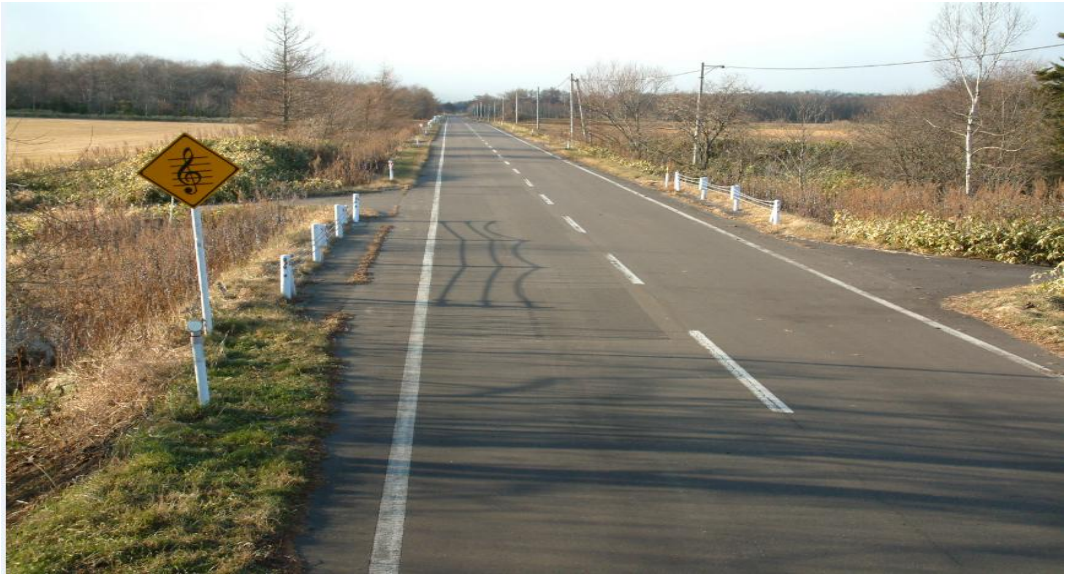
北海道 標津町 川北 知床抒情