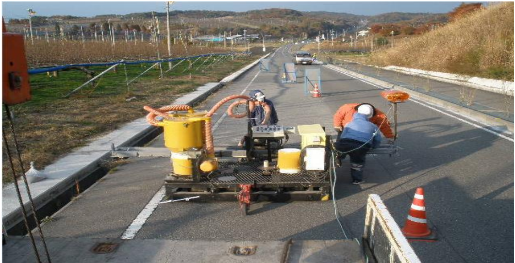
広島県 世羅町 フルーツ・ふれあい道路 トロ・森の熊さん