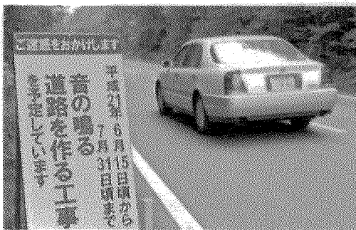
メロディーロードの工事が進む県道富士河口湖・富士線

安全運転に心掛けてもらおうと、最適なメロディーは時速50キロ走行に設定した。路面に溝を刻むことで、スリップ防止や雨天時の路面排水にも効果があるという。同事務所は「通行車両が増える8月前に工事を終えたい」としている。